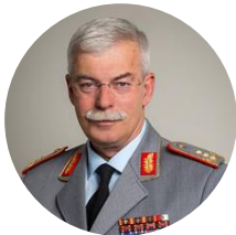
Jörg Vollmer General a.D. Bundeswehr