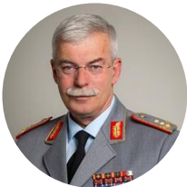
Jörg Vollmer General a.D. Bundeswehr