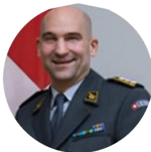
Kkdt. Thomas Süssli Chef der Armee