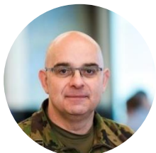
Oberst i Gst Robert Flück Projekt Kommando Cyber, Schweizer Armee