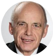
Ueli Maurer Bundesrat Vorsteher EFD