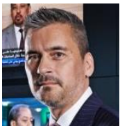
Jürg Bühler Vizedirektor Nachrichtendienst des Bundes (NDB)