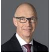
Thomas Scheitlin Stadtpräsident St. Gallen