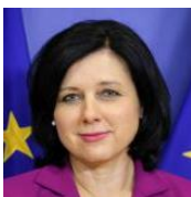
Věra Jourová Vizepräsidentin der Europäischen Kommission für Werte und Transparenz