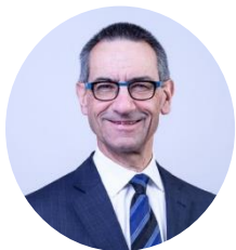
Stefan Holenstein Präsident Landeskonferenz militärischen Dachverbände (LKMD)