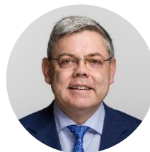
Franz Grüter Nationalrat, green.ch-Gruppe